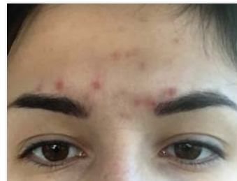
ZMIANY TRĄDZIKOWE W OBRĘBIE CZOŁA (KOBIETA, 30 LAT)

To kolejny ekspresowy zabieg w ofercie Bielenda Professional. Jego wykonanie zajmuje około 20–25 minut. Na procedurę zabiegową w gabinecie składa się demakijaż oraz aplikacja dwóch masek z kwasami (jedna po drugiej, bez zmywania). Obie maski dokładnie wcieramy w skórę. Dzięki temu łączymy działanie składników aktywnych zawartych w produktach z mechanicznym usunięciem komórek naskórka, gwarantując przy tym równomierne wnikanie kwasów. Klientka zmywa preparaty w domu, po upływie czasu zaleczonego przez osobę wykonującą zabieg.