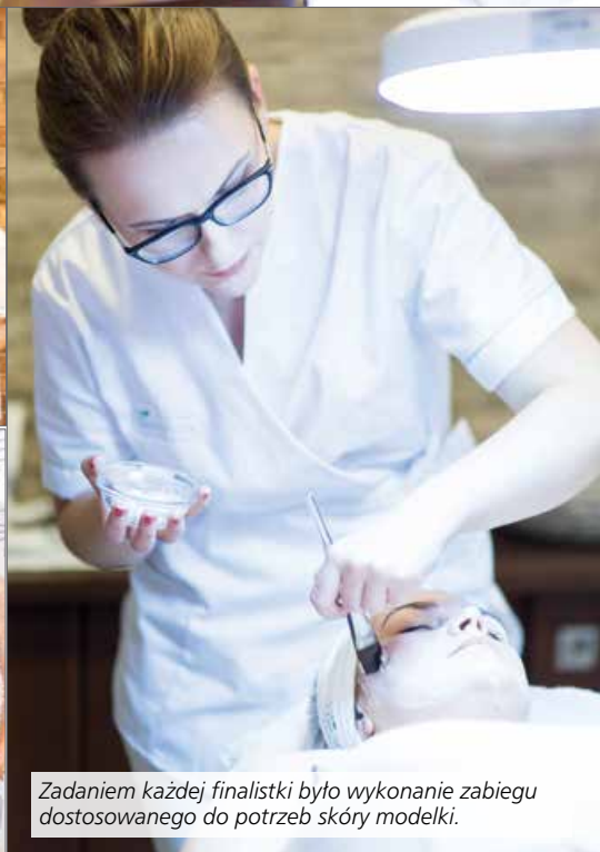
Zadaniem każdej finalistki było wykonanie zabiegu dostosowanego do potrzeb skóry modelki.