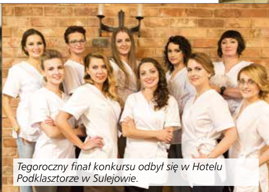
Tegoroczny finał konkursu odbył się w Hotelu Podklasztorze w Sulejowie.