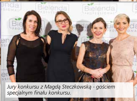
Jury konkursu z Magdą Steczkowską - gościem specjalnym finału konkursu.