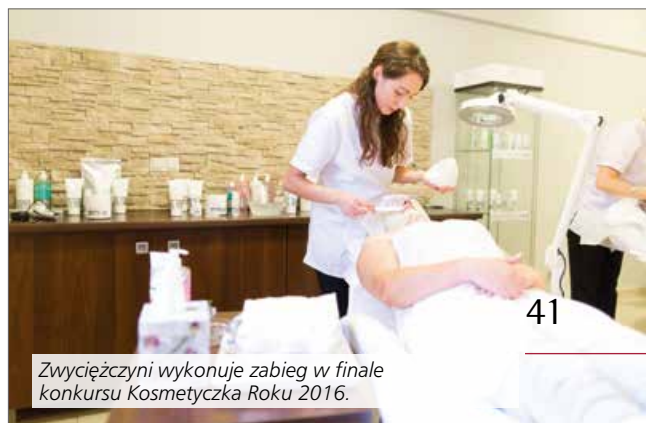
Zwycięzcy wykonuje zabieg w finale konkursu Kosmetyczka Roku 2016.

K osmetyczka Roku 2016 mieszka i pracuje w Krakowie. Jest kosmetologiem z ponad 8-letnim doświadczeniem pracy w zawodzie. Pasjonują ją nowe substancje w kosmologii – jest ekspertką i konsultantem w zakresie składników kosmetycznych. Prowadzi cenionego bloga, na którym