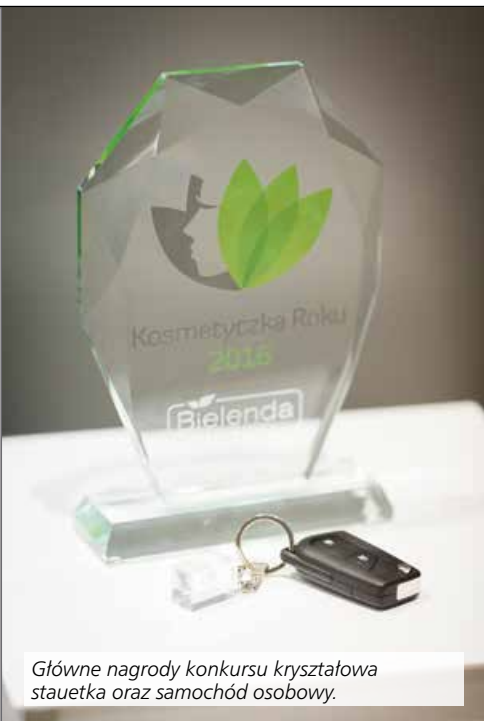
Główne nagrody konkursu kryształowa statuetka oraz samochód osobowy.